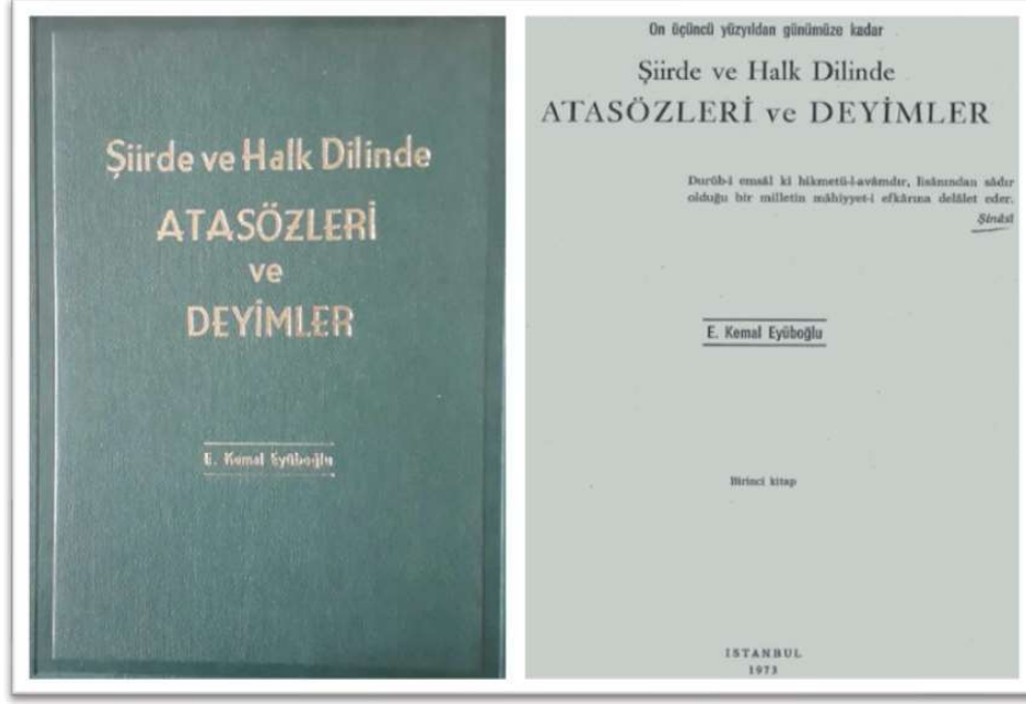
Resim 1: Eserin kapak görüntüleri

örneği bulunmayan deyimler ise, baş harfler sırasına göre, sözlük düzeninde, okuyucuya sunulmuştur. Amacı, her deymi yerinde bulmak ve Türk şiirinde karşılığını arama zevkini okuyucuya tattırmaktır.” 2