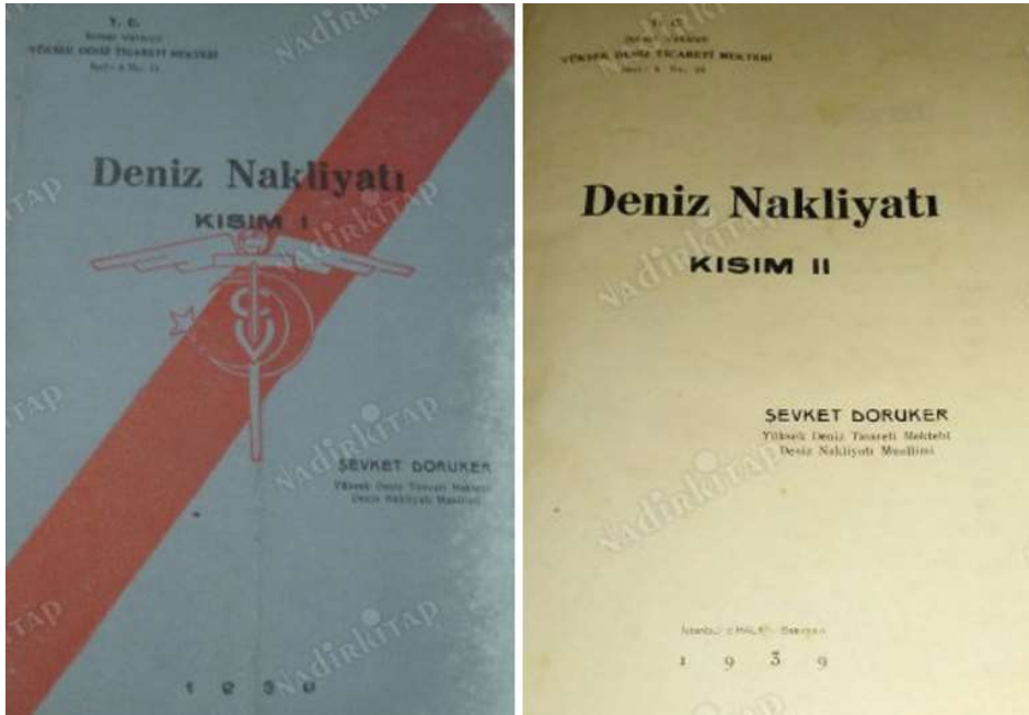
Resim 2: Deniz Nakliyatı kitabının kapak resimleri