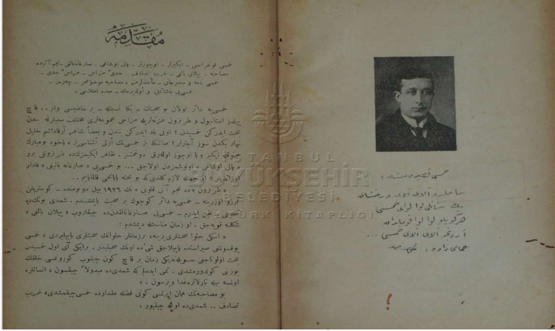
Resim 2: Hamâmîzâde İhsan Efendi'nin İBB Atatürk Kitaplığı'nda bulunan Hamsinâme eserinin üçüncü ve dördüncü sayfalarının görseli