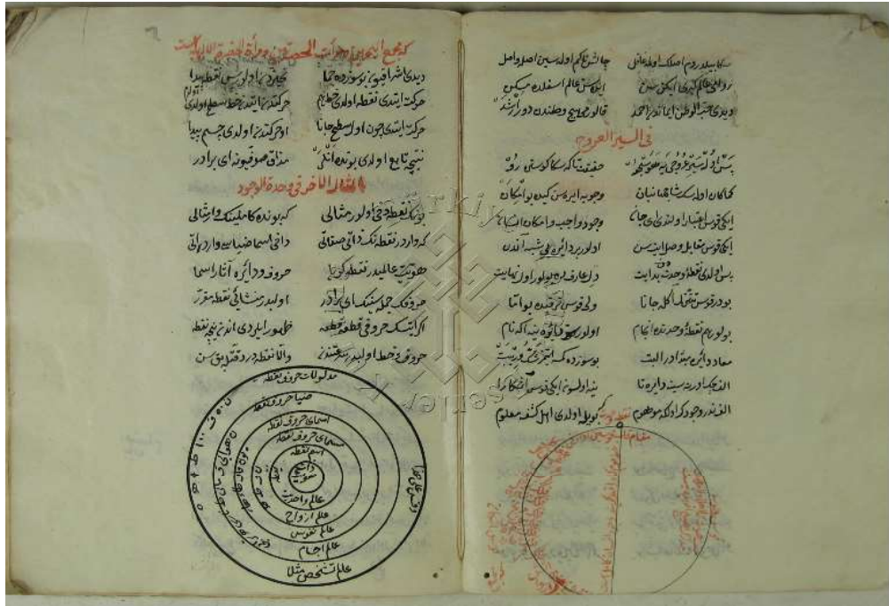
Resim 1: Saliha Hatun nüshasına ait görseller