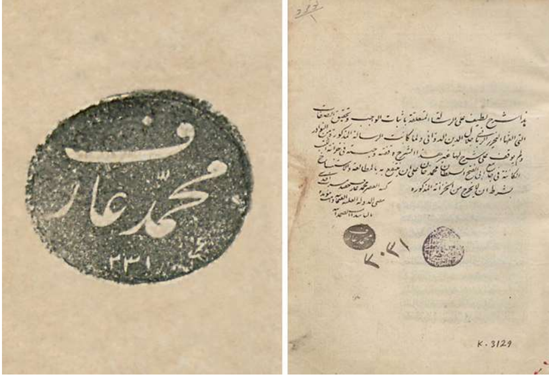
Resim 2: Meşrepzâde Ârif Efendi'nin mührü 42 ve mührün yer aldığı bir eser 43