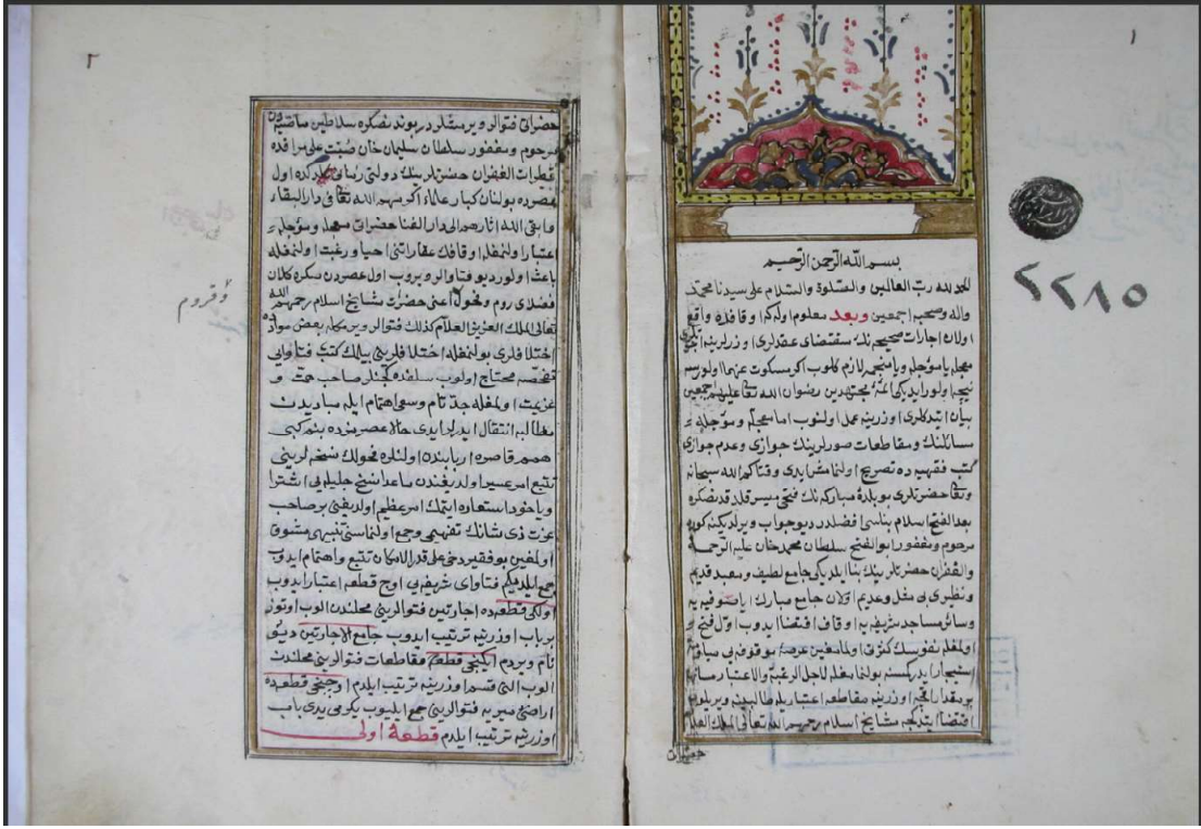
Resim 1: Camii'l-İcareteyn'in Süleymaniye Yazma Eser Kütüphanesi Fatih Koleksiyonu 2285 numaralı nüshasının ilk iki sayfası