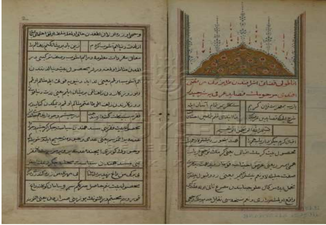
Resim 1: Eserin ilk iki sayfası (İ.B.B. Atatürk Kitaplığı Belediye Yazmaları, Bel_Yz_K.000430/01)

mergûm ʿāzīm tekellüflere düşüp şifā-yı şadr virür bir ma nāya muvaffak olamaduklarıdır.” şeklindeki açıklamaları bu tutumuna örnek olarak gösterilebilir. 2