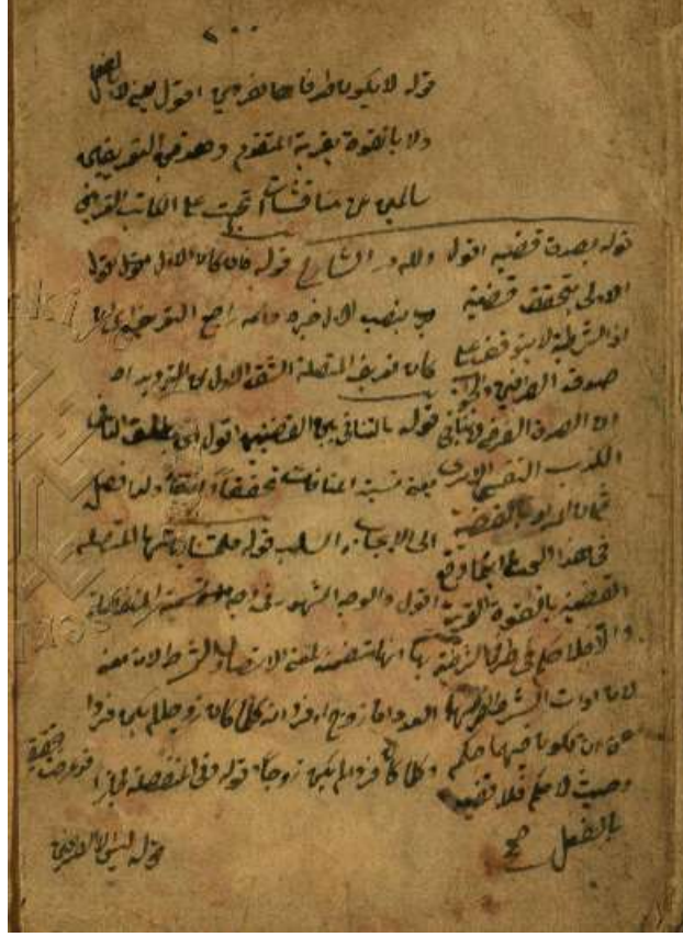
Resim 4: Muhammed Sa'îd b. Ali el-Ôfi'nin Muzîhu's-Si'ab âle Muğni't-Tullâb adlı eserinin Milli Kütüphane Yazmalar Koleksiyonundaki nüshasının son sayfası