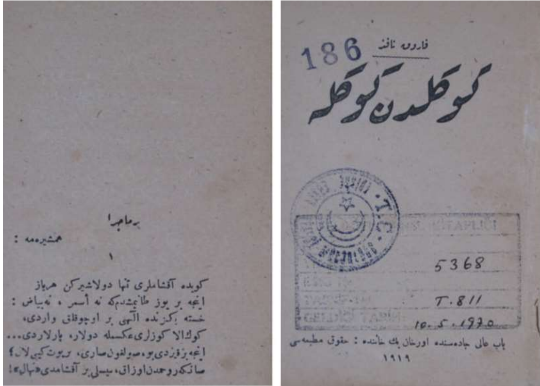
Resim 3: 1919 yılında Hukuk Matbaası Matbaası'nda basılan eserin ilk ve ikinci sayfası