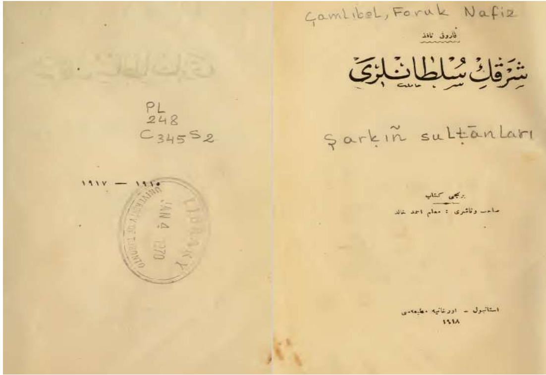
Resim 1: Muallim Ahmed Hâlid tarafından 1918 yılında Orhâniye Matbaası'nda basılan eserin ilk iki sayfası