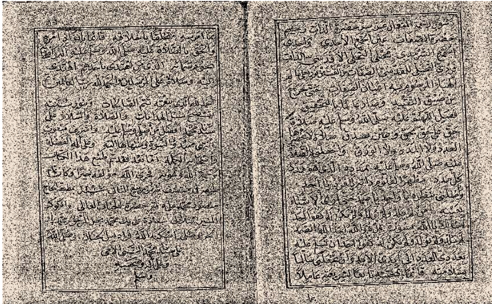
Resim 2: Muhammed Muntazar Trabzonîzâde'nin es-Salavâtü'l-muntaziriyye isimli matbu eserinin (Matba'atü'l-Hâc Muhammed Ali 1294) son iki sayfası