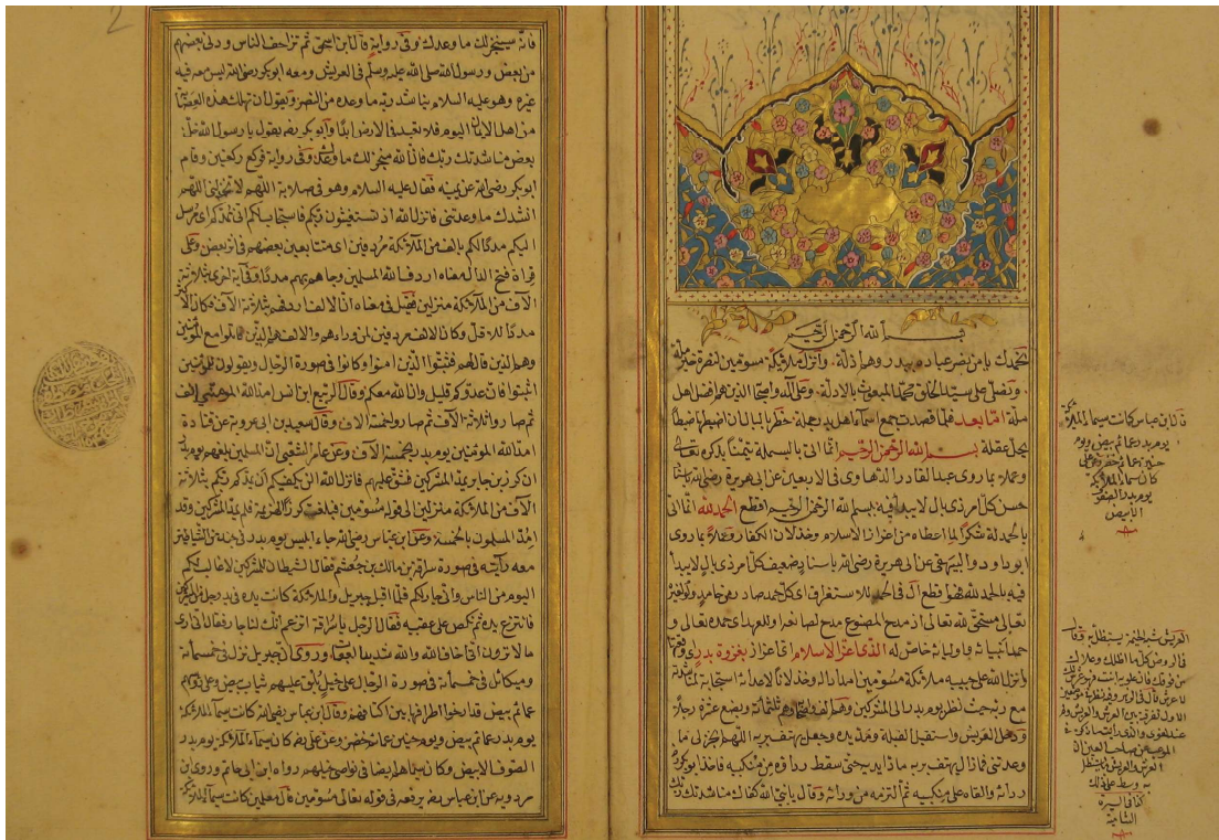
Resim 1: Şerh-u Esmâ-i Ehl-i Bedr Risalesi'nin ilk varakları