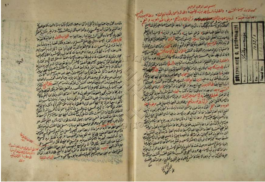
Resim 4: Medeni'nin Câmiu'l-a'zam fi esmâi nebiyyi'l-mu'azzam Adlı eserinin ilk sayfası