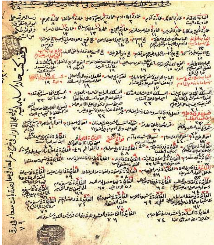
Resim 3: Câmi 'u'l-fusûl Risalesi'nin mündericât kısmı