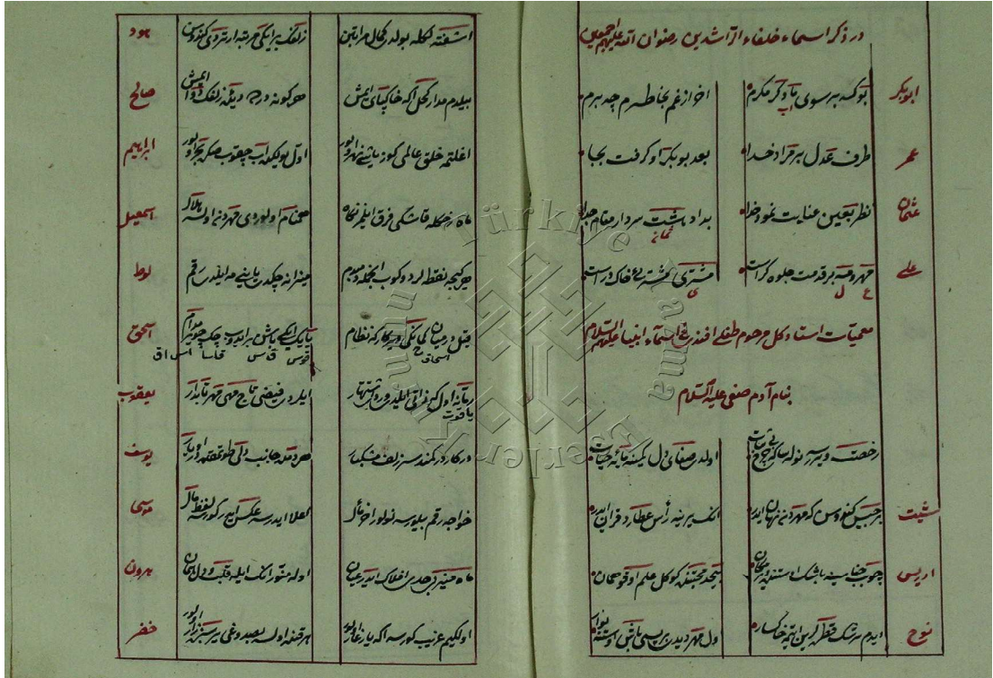
Resim 1: Süleymaniye, Pertev Paşa, 610-09, vr. 55b-56a

Beytinde şair, Hızır Peygamberi “sebz” kelimesiyle karşılamıştır. Hızır Arapça'da, sebz Farsça'da “yeşil” anlamındadır.