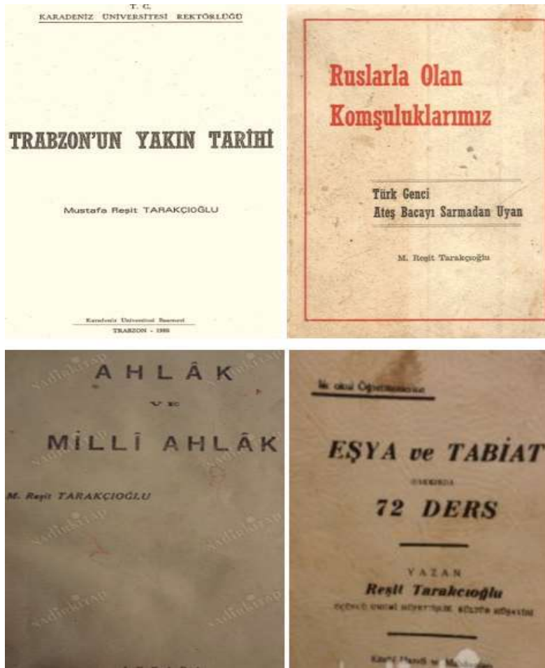
Resim 2: Eserlerinin kaprak resimleri