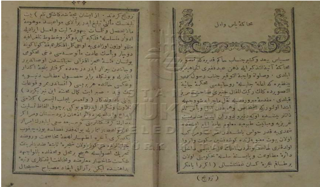
Resim 3: Muhakeme-i Ye's ü Emel'in ilk sayfaları (Tasvîr-i Efkâr Baskısı)