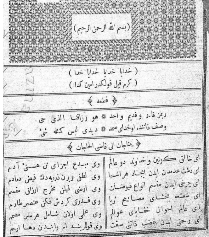
Resim 1: Divan ve Münşeâtın ilk sayfası (Trabzon Vilayet Matbaası)

Şairin şiirlerinde dinî-tasavvûfî öğeler baskındır. Öğretici, uyarıcı bir dil kullanmıştır. Belki de bu sebeple nesirde daha kabiliyetlidir. Gazellerinde âşıkane tavır pek görülmemektedir. Emin Hilmî için irfan sahibi bir zat olduğu şiir ve nesrinden anlaşılmaktadır diyen İbnül Emin, dîvânında güzel sözlere bazen tesadüf edilir diyerek şiir kabiliyetinin pek de olmadığına işaret etmektedir. 14 Bursalı Mehmed Tahir, nesri nazmına faiktir demektedir. 15