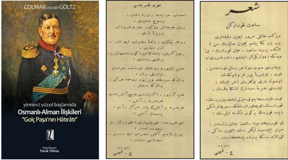
Resim 2: Devlet-i Âliyye'nin Za'f ve Kuvveti isimli eserin yeniden yayıma hazırlanmış hali ile yazarın Servet-i Fünûn dergisinde yayımlanan "Ud Darbesi" ve "Saat Kurarken" başlıklı şiirleri