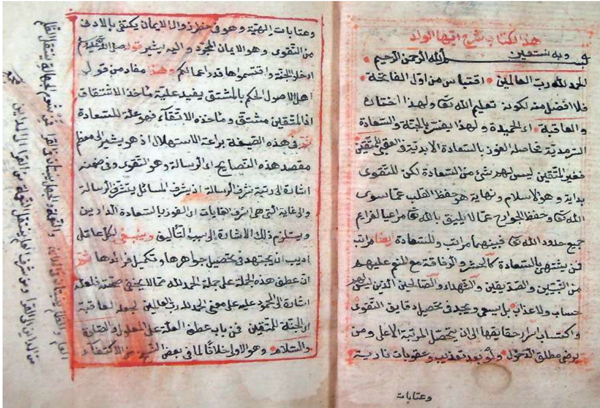
Resim 1: Eserin ilk iki sayfası (Trabzon İl Halk Kütüphanesi, nr. 435/1)